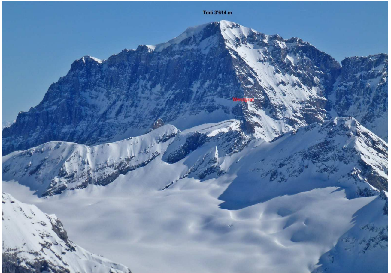
SAC-Sommertourenwoche 2012, die Besteigung des Tödis über den Westgrat